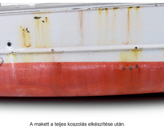
A makett a teljes koszolás elkészítése után.