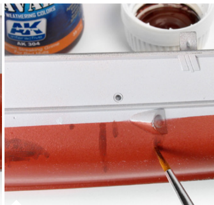
Először csak a vörösre festett részekre vigyük fel a terméket. Készítsünk függőleges csíkokat, valamint kisebb-nagyobb foltokat is.