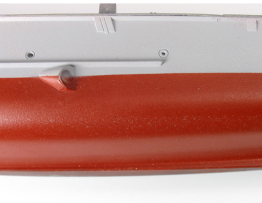
Vigyük fel a két alapszint.