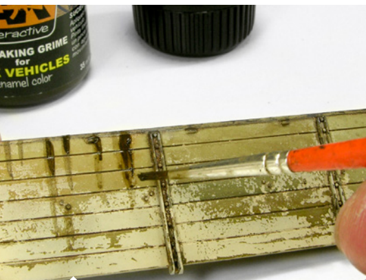
Érdemes egy vékony, jó minőségű ecsetet használnunk a vonalak megfestéséhez.