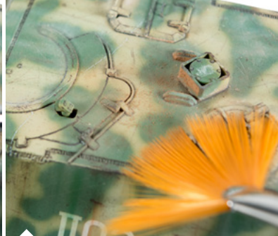
Lágy mozdulatokkal dörzsöld rá a felületre.