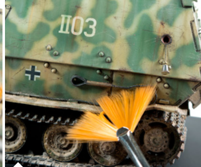
Távolítsd el a felesleget és ellenőrizd a végeredményt.