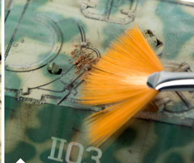
A legyező formájú ecset segítségével terítsd szét a pigment port a kívánt területen.