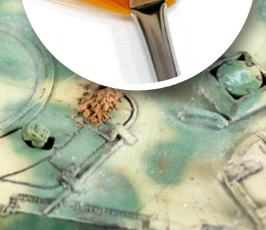
Vigyél fel egy kevés pigmentet.