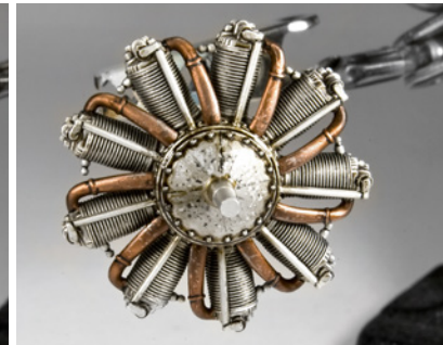
Olajsíkokat és fröcsköléseket is festhetsz a hajtóműre, hogy erősítsd a megjelenést.