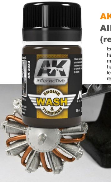
Egy hajtómű csak a gyárban néz ki ilyen tisztán.