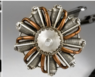
Erősebben tudod megjeleníteni a hatást, ha több rétegben használod a terméket, elég időt hagyni az egyes rétegek száradásának.