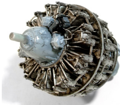
Azonban már egy világos átmosó használatával is drámaian megváltozik a megjelenés. Kiemeli és mélységet ad a részleteknek.