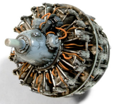
Érdeemes összehasonlítani a két állapotot. A különbség teljesen nyilvánvaló.

Az Air Series további termékeivel kombinálva a lehetőségeid szinte korlátlanok, azonban mindenképp tanulmányozd az eredeti képeket, hogy a lehető legrealisabb eredményt érhesd el.