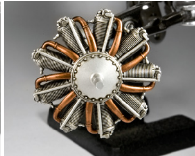
Egy közepes méretű ecset segítségével könnyedén mosd át a hajtóművet, ügyelve, hogy minden zugba és résbe jusson a folyadék.